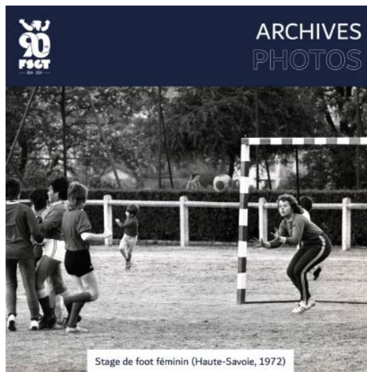
Stage de foot féminin (Haute-Savoie, 1972)

Mon regard se pose sur la femme en face de moi, elle lit un livre. Une secousse de la rame lui fait lever les yeux. Nos regards se croisent, un sourire timide. Sur la couverture deux mots : femme et sport. Des mots simples. Deux mots qui, il n'y a pas si longtemps, ne pouvaient pas se suivre avec autant de facilité, de légèreté, de façon aussi désinvolte. Qui aurait pensé qu'aujourd'hui, les femmes puissent pratiquer une activité physique, aller s'inscrire dans un club ou devenir championnes du monde dans leur discipline. La libération des corps s'est faite grâce à des femmes et des hommes qui ont osé casser les codes et dit oui à l'accès des femmes au sport.